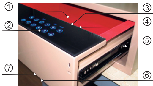
Разметка фронтальной части для установки фасада