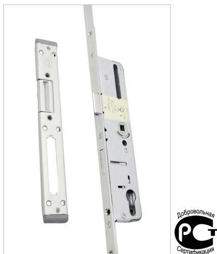
Фото 5. Многозапорный замок Elementis