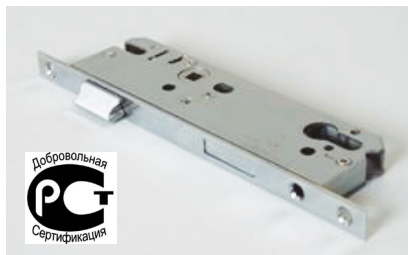
Фото 3. Однозапорный замок Elementis с ригелем и фалевой защелкой