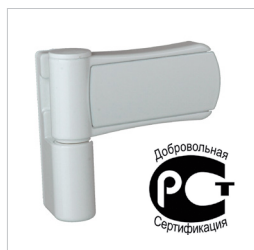
Фото 1. Петля Elementis Elephant/ Elephant Junior