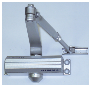
Фото 11. Доводчик Elementis, серии 602/603/604