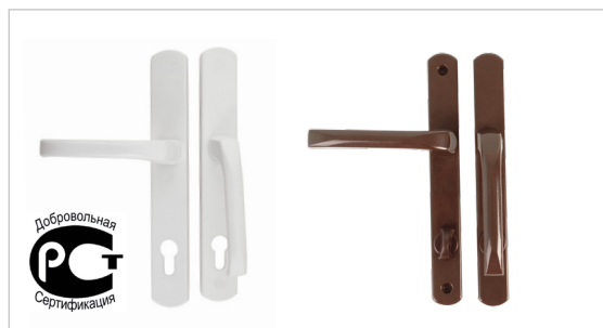
Фото 2. Гарнитур Elementis, серия Deniz/ Deniz WC