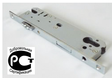
Фото 4. Однозапорный замок Elementis с ригелем и роликовой защелкой